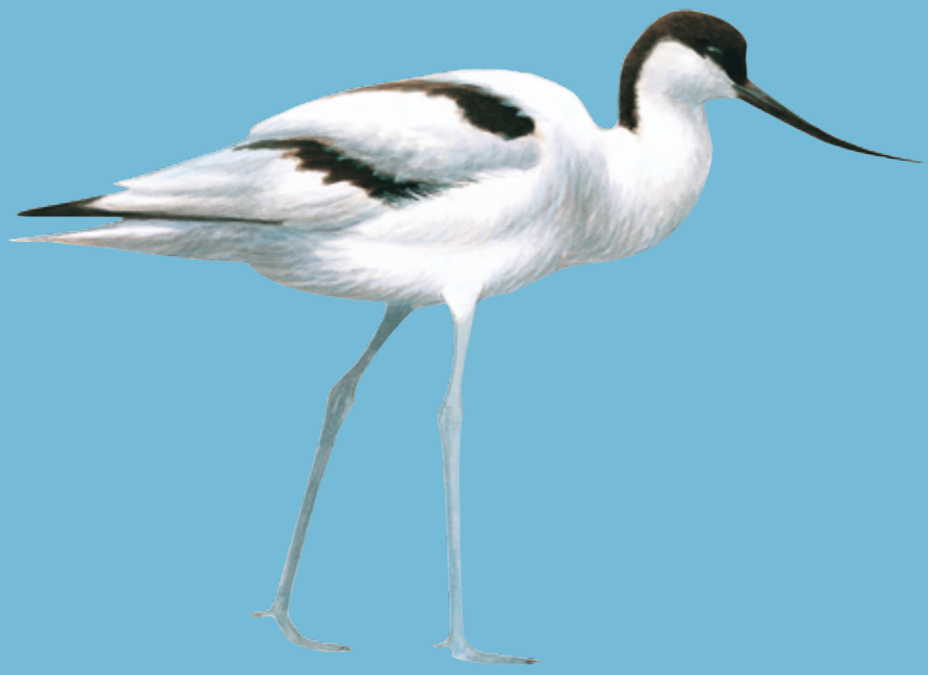
Pied Avocet Kluut Säbelschnäbler Klyde