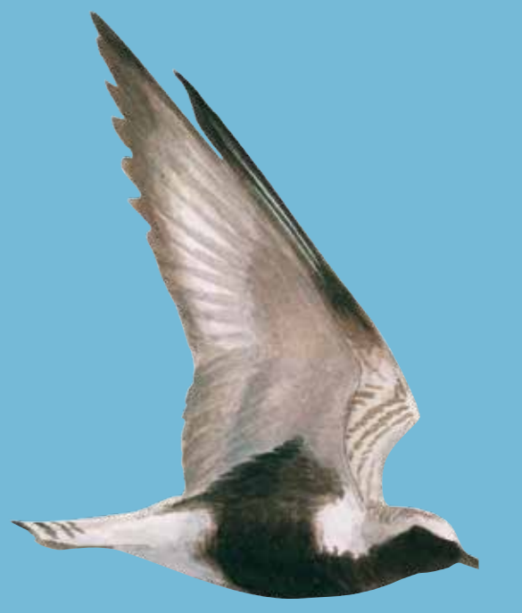
Grey Plover Zilverplevier Kiebitzregenpfeifer Strandhjejle

Beskyttede fugle kræver beskyttede vådområder!