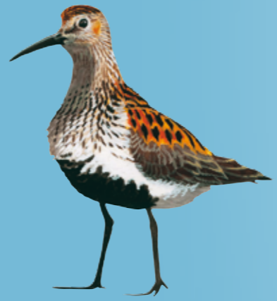
Dunlin Bonte Strandloper Alpenstrandläufer Almindelig Ryle