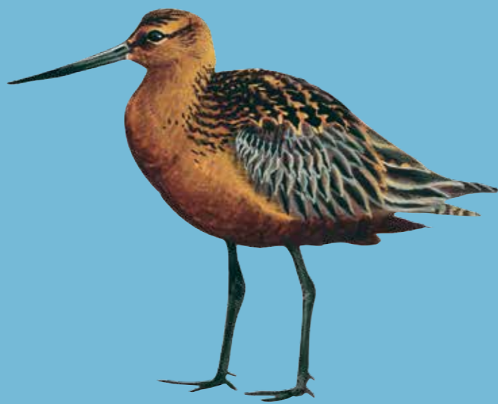
Bar-tailed Godwit Rosse Grutto Pfuhschnepfe Lille Kobbersneppe