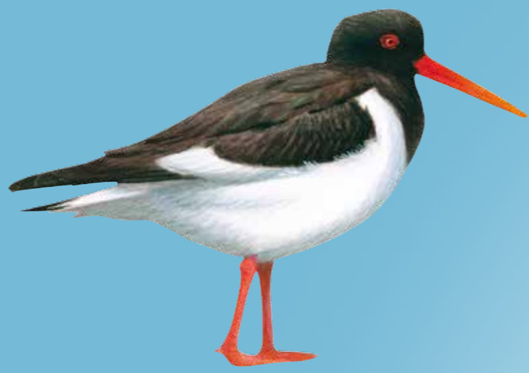
Eurasian Oystercatcher Scholekster Austernfischer Strandskade

Breeding ground Broedgebiet Brutgebiet Yngleområde