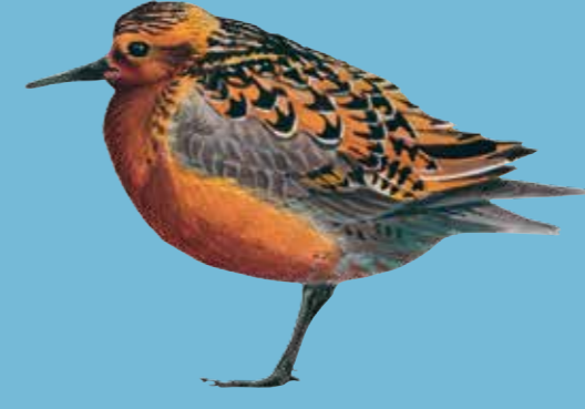
Red Knot Kanoetstrandloper Knut Islandsk Ryle